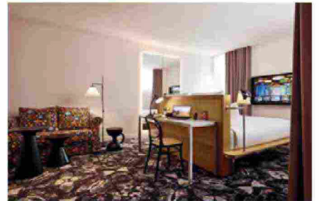
A melting pot of styles and cultures, between the classical and the contemporary, in a kaleidoscope of fascinating memories and images